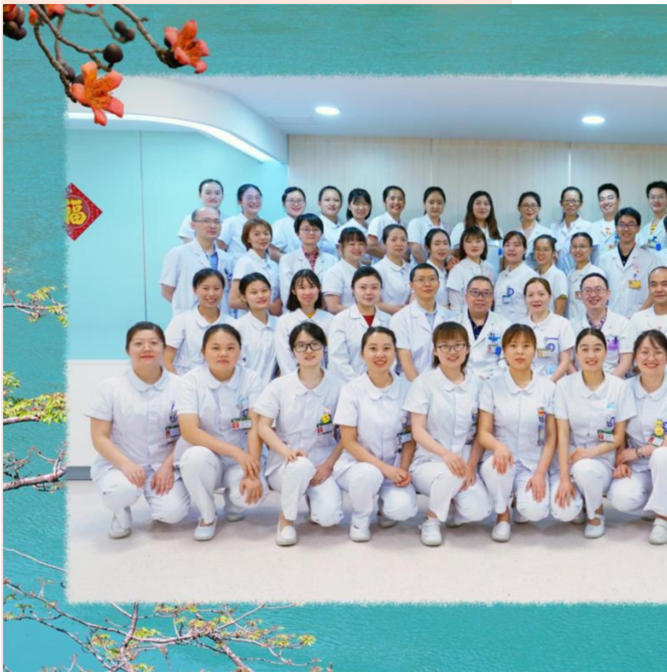
供稿：肿瘤科 周雪宇

、深部热疗、生物治疗、癌痛治疗为特色的科室。在省卫健委全省三甲医院肿瘤科排名中，我科肿瘤专科能力名列攀西地区第一名。